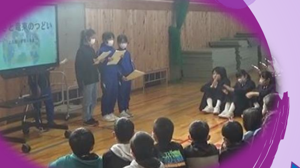
6年生：ふるさと竜東の集いにて